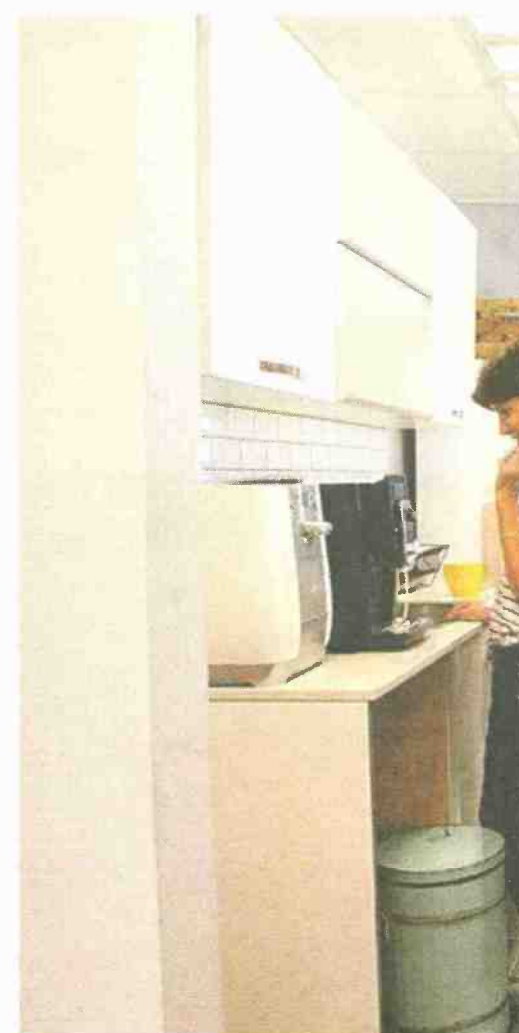
מלמעלה משמאל בכיוון השעון: מולטי בריק לחיפוי פנים וחוז' של אבן סיב, משרדי אינטנטיקס, עיצוב מסעדה באדיבות אבן סיב, משרדי inspiration group